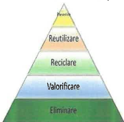
Fig.1 Ierarhia gestionării deșeurilor

Se alege metoda cea mai potrivită pentru a gestiona deșeurile generate. Această practică este o obligație specificată în OUG 92/2021. Pentru a gestiona corect deșeurile generate și pentru a le reduce, se optează pentru una din operațiunile schemei de ierarhizare a deșeurilor. Obligația societății GRANDEMAR SA în calitate de generator și deținător de deșeuri este de a valorifica deșeurile, în măsura în care acestea se pretează acestei operațiuni.